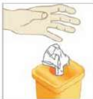
دستمال استفاده شده را بلافاصله در ظرف زباله مناسب بیاندازید.