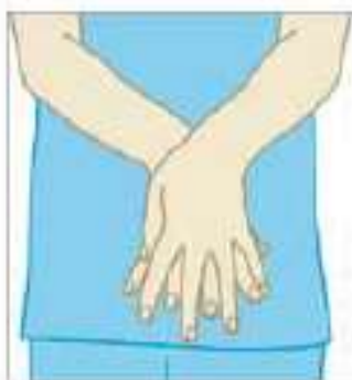
عملیات بهداشت دست ها را انجام دهید