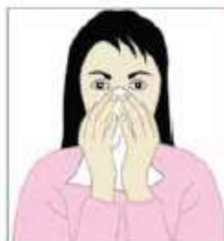
بینی و دهان خود را بپوشانید.