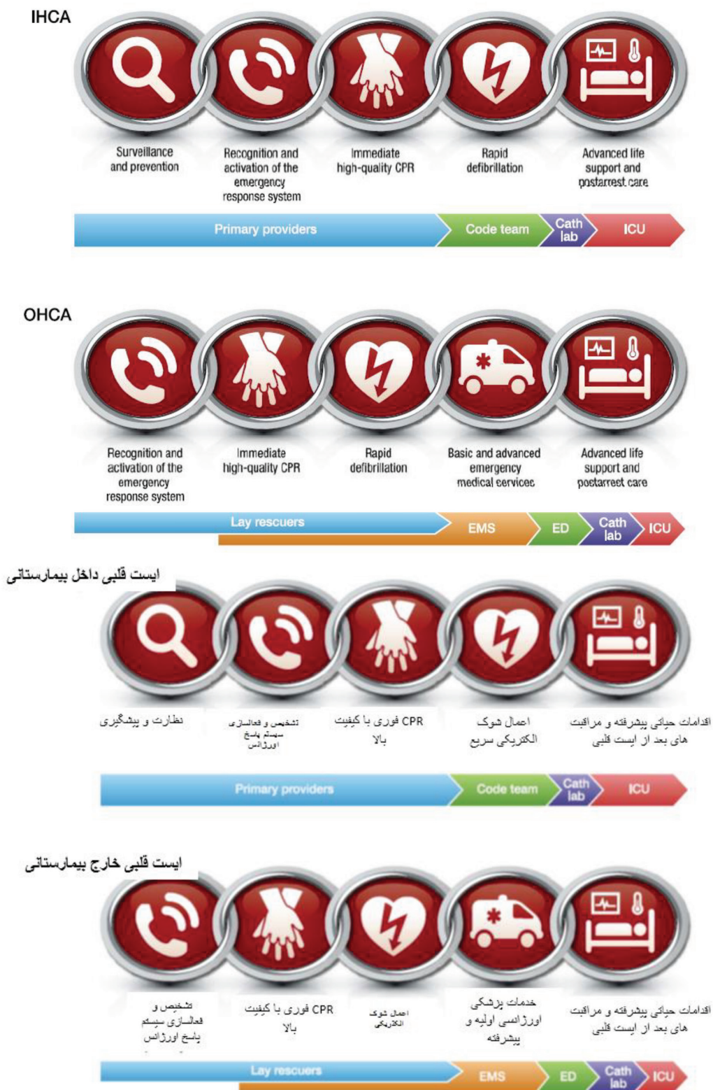
شکل ۱- زنجیره‌های بقای ایست قلبی داخل و خارج بیمارستانی (۱۰)

گیرند. در مقابل، بیمارانی که دچار ایست قلبی در داخل بیمارستان می‌شوند، به تعامل متقابل بخش‌های مختلف بیمارستان و خدمات آن و نیز یک تیم چند رشته‌ای از ارائه دهندگان حرفه‌ای مراقبت