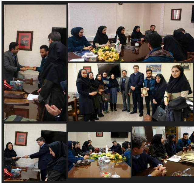
2-5- خرید کتاب های مورد نیاز برای دانشجویان استعداد درخشان