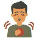
درد قفسه سینه