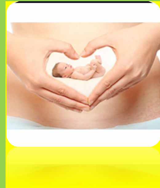
تهیه کننده :