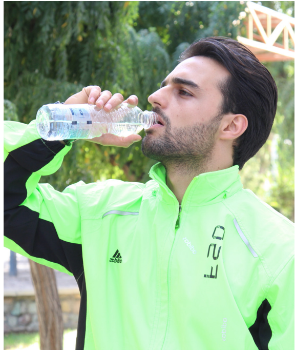
هنگام انجام فعالیت بدنی توجه به نکات زیر اهمیت دارد:

■ اگر روزها خارج از منزل پیاده‌روی می‌کنید، حتماً از کرم های ضد آفتاب یا کلاه استفاده نمایید. اگر شب و خارج از منزل پیاده‌روی