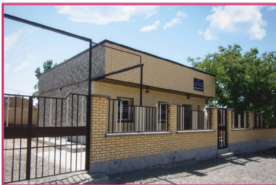
در خانه‌های بهداشت، بهورزان مشغول بکار هستند