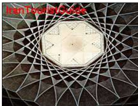
شکل ۱-۲) نمونه شکل