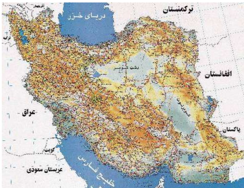
نقشه ۲-۳) نمونه نقشه