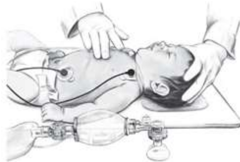
شکل ۲- تکنیک ماساژ قفسه سینه با دو انگشت در شیرخوار (یک امدادگر)

اگر تنفس را منظم دیدید، قربانی نیاز به CPR ندارد. اگر شواهدی به نفع تروما وجود ندارد، بیمار را به پهلو بچرخانید (وضعیت بهبودی) که کمک می‌نماید راه‌هوایی باز نگه داشته شود و خطر آسپیراسیون را کاهش می‌دهد. اگر قربانی پاسخ‌دهی ندارد و نفس نمی‌کشد (یا تنفس بریده و گهگاه دارد)، CPR را شروع کنید. برخی اوقات ممکن است قربانیانی که نیاز به CPR دارند، تنفس بریده بریده و گهگاه داشته باشند که ممکن است به اشتباه، تنفس در نظر گرفته شود. بیماری را که تنفس بریده بریده و گهگاه دارد، همانند بیماری که تنفس ندارد درمان کنید و CPR را شروع کنید.