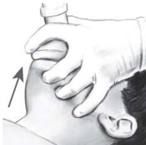
شکل ۶- تکنیک کلامپ EC برای تهویه با بگ- ماسک، سه انگشت یک دست، فک را بالا می‌آورند (که E را تشکیل می‌دهند) در حالی که انگشت شست و اشاره ماسک را روی صورت نگه می‌دارند (که C را تشکیل می‌دهند).

تهویه با بگ - ماسک یک تکنیک بسیار مهم CPR برای کارکنان بهداشتی است. تهویه با بگ - ماسک نیازمند آموزش و بازآموزی مکرر برای مهارت‌های ذیل دارد: انتخاب ماسک با اندازه مناسب، باز نمودن راه هوایی، درزگیری خوب بین ماسک و صورت، برقراری تهویه مؤثر و ارزیابی اثربخشی تهویه. برای شیرخواران و کودکان کوچک‌تر، از بگ با قابلیت پرشدگی خودبه‌خود با حجم حداقل ۴۵۰-۵۰۰ mL استفاده کنید، زیرا ممکن است بگ‌های کوچک‌تر حجم جاری مؤثر یازمان دم طولانی‌تری را که مورد نیاز نوزادان کاملاً ترم و شیرخواران است، فراهم نکند. در کودکان بزرگ‌تر و یا نوجوانان، برای بالا آمدن قفسه‌سینه با اطمینان کامل، ممکن است نیاز به بگ بزرگسالان، با قابلیت پرشدگی خودبه‌خودی (۱۰۰۰ ml) باشد.