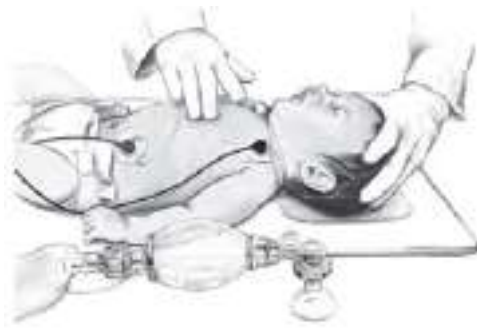
شکل ۲- تکنیک ماساژ قفسه‌سینه با دو انگشت در شیرخوار (یک امدادگر)

در شیرخواران، امدادگر تنها (چه امدادگر غیرحرفه‌ای و چه کارکنان بهداشتی) باید استرنوم را با دو انگشت (شکل ۲)، دقیقاً زیر خط متصل کننده دو نیپل قربانی فشار دهد. نباید زائده گزیفوئید یا دنده‌ها فشار وارد آورد. امدادگران باید قفسه‌سینه را حداقل به اندازه یک سوم قطر قفسه‌سینه یا حدود ۴ سانتی‌متر (۱/۵ اینچ) بفشارند.