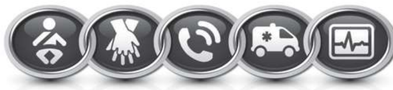
شکل ۱ - زنجیره بقا در کودکان

تمامی امدادگران باید بتوانند ماساژ قفسه‌سینه را تقریباً بلافاصله شروع کنند. در حالی که وضعیت دادن به سر و درزگیری برای تنفس دهان به دهان یا بگ - ماسک برای تنفس مصنوعی وقت‌گیر است و آغاز ماساژ قفسه‌سینه را به تأخیر می‌اندازد. در شیرخواران و کودکان، ایست قلبی ناشی از خفگی شایع‌تر از VF می‌باشد و تهویه در احیای کودکان بسیار مهم است. از لحاظ تئوری، شروع CPR با ۳۰ ماساژ و سپس ۲ تهویه توسط یک امدادگر تنها، موجب تأخیر ۱۸ ثانیه‌ای برای شروع تهویه می‌شود که این زمان در صورت وجود دو امدادگر، کوتاه‌تر است. توالی CAB برای شیرخواران و کودکان جهت سادگی آموزش و با امید به اینکه قربانیان ایست قلبی ناگهانی، توسط فرد ناظر CPR شوند، توصیه می‌گردد. این امر سبب ثبات و یکپارچگی در آموزش امدادگران می‌شود، چه بیمار شیرخوار باشد، چه کودک و یا بزرگسال.