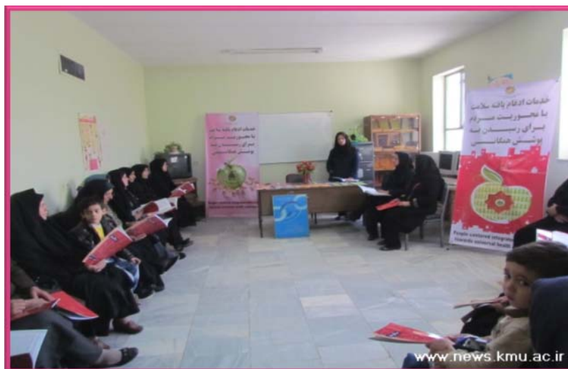
برگزاری کلاس‌های رابطان سلامت به صورت حضوری و با الگوی مشارکتی اداره می‌شود