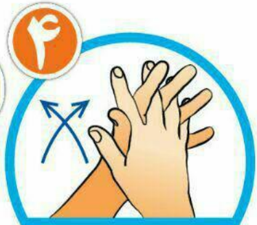
بین انگشتان را از روبرو بشویید.