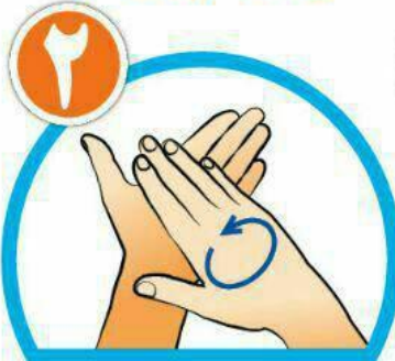
کف دست‌ها را با هم بشویید.