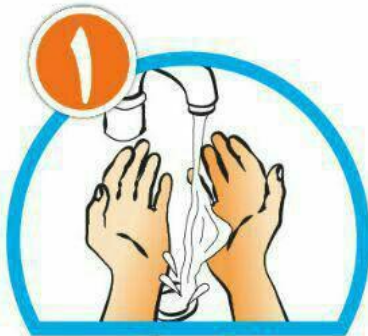
دست‌ها را خیس کرده و بعد آن‌ها را صابونی کنید.