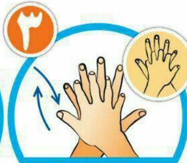
بین انگشتان را در قسمت پشت بشویید.