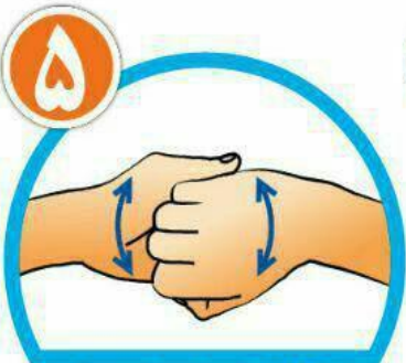
نوک انگشتان را درهم گره کرده و به خوبی بشویید.