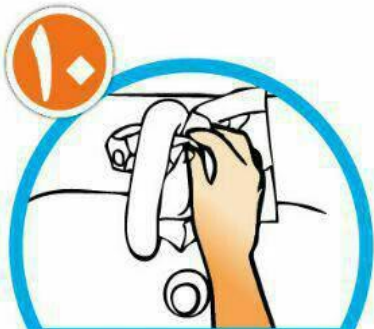
با همان دستمال شیر آب را ببندید و دستمال را در سطل زباله بیاندازید.