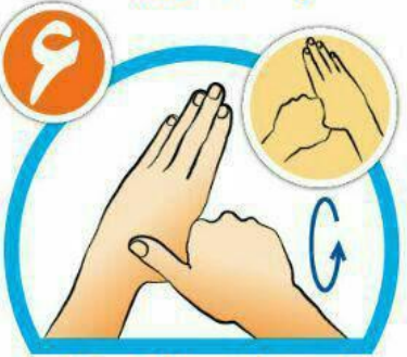
شست‌ها را جداگانه و دقیق بشویید.