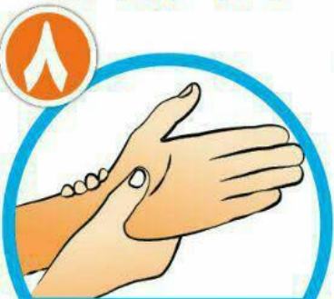
دور مچ هر دو دست را بشویید.