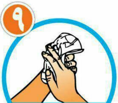
دست‌ها را با دستمال خشک کنید.