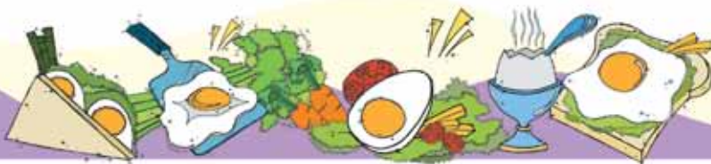
جدول ۱ - اجزای غذایی تقریبی یک تخم مرغ بزرگ (۶۰ گرم)