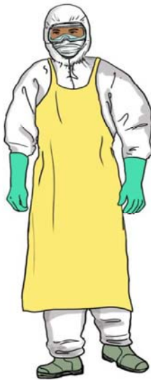
تجهیزات کامل حفاظت فردی