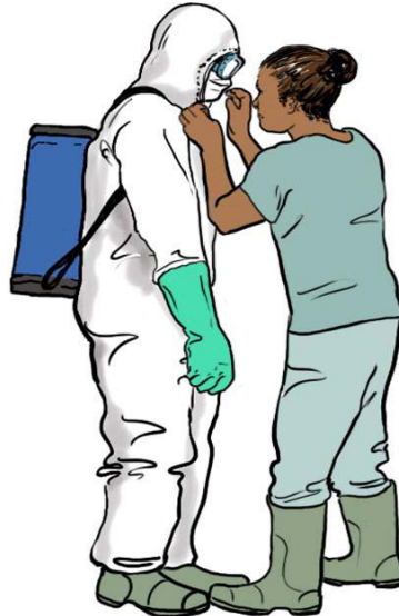
سم پاش و کارگر سم پاش با تجهیزات کامل سم پاشی