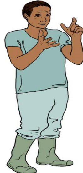
افراد خانواده فرد مبتلا