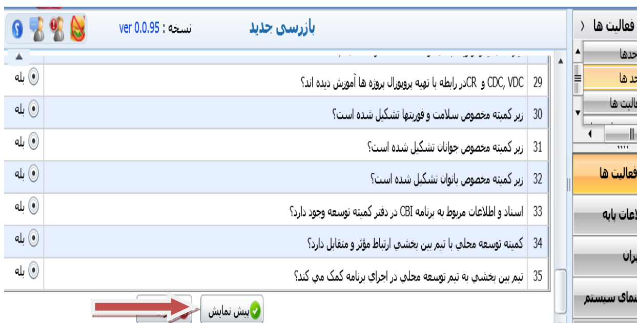
شکل ۹: انتخاب گزینه پیش نمایش تکمیل چک لیست

شکل ۹ در پایین صفحه بر روی گزینه پیش نمایش کلیک نموده و سپس برای تکمیل ثبت بازرسی مطابق شکل های ۱۰ و ۱۱ عمل نمایید.