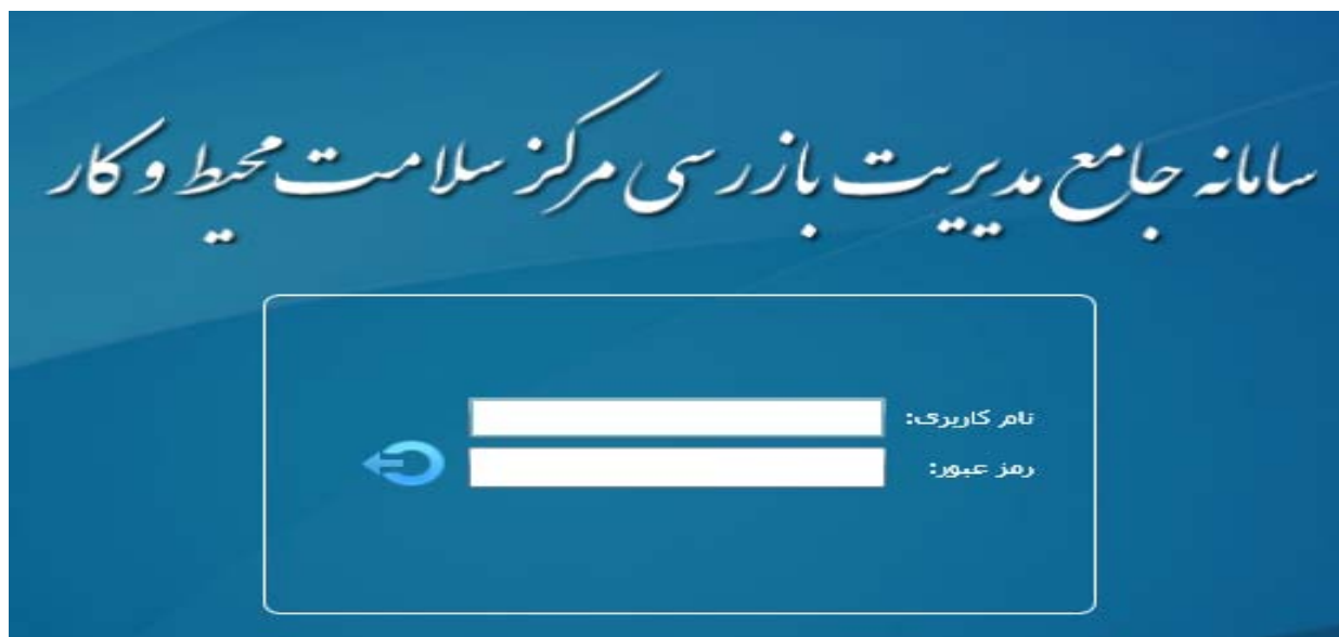
شکل ۲: صفحه ورود نام کاربری و رمز عبور

عبور وارد صفحه اصلی سامانه جامع مدیریت بازرسی می شویم و گزینه مدیریت واحدها را کلیک می نماییم. (شکل ۳)