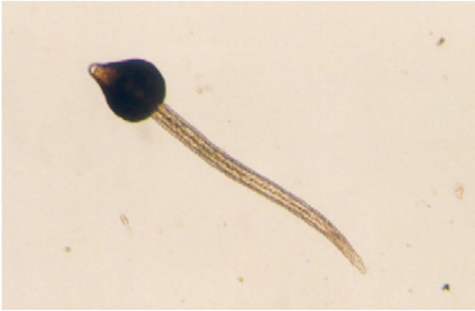
شکل ۶- سرکر فاسیولا

است، ولی به نظر می‌رسد که بیشترین میزان تولید سرکر بین نیمه شب و ساعت ۱ بامداد صورت می‌گیرد (شکل ۶).