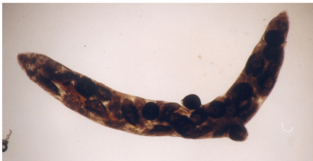
شکل ۵- ردی بالغ فاسیولا

در مدت ۲۴ ساعت خواهد مرد. میراسیدیم پس از نفوذ در بدن حلزون، به یک جسم کیسه‌ای شکل به نام اسپوروسیست (Sporocyst) تغییر شکل می‌یابد. در این اسپوروسیست شکل دیگری از انگل به نام ردی (Redia) به وجود می‌آید (شکل ۵).