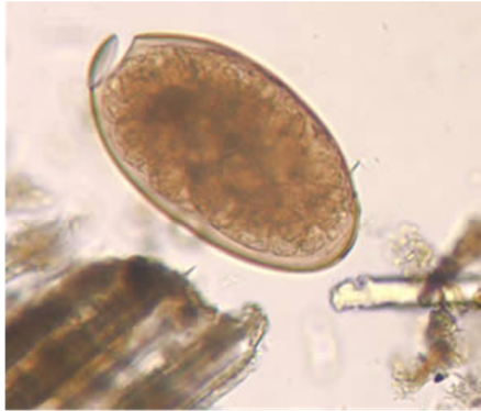
شکل ۴- تخم فاسیولا

در موقع دفع نارس می‌باشند، فقط در صورت رسیدن به آب تکامل می‌یابند (شکل ۴).