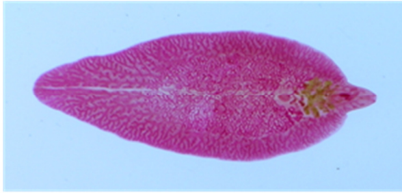
شکل ۱- بالغ فاسیولا هپاتیکا