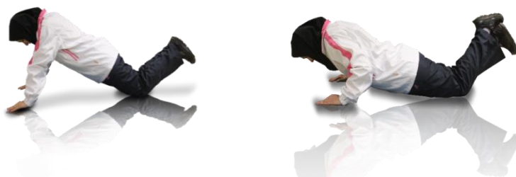
شیوه انجام حرکت برای خانم‌ها

حرکت را دقیق و صحیح انجام دهید، تکرار کنید.