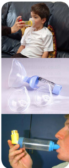
تصویر ۶: محفظه مخصوص