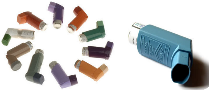
تصویر ۷: افشانه یا MDI