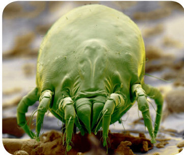
تصویر ۳: مایت

هییره‌ها بندپایانی میکروسکوپی هستند (حدوداً ۰/۳ میلی‌متر) که با چشم غیرمسلح دیده نمی‌شوند. تغذیه این موجودات از پوسته‌ریزی بدن انسان است. محل زندگی این حیوان در لابه‌لای پرزهای فرش، پتو، میلمان، پرده، تشک، بالش، اسباب بازی‌های پشمی و پارچه‌ای و وسایل مشابه است. شرایط آب و هوایی گرم مرطوب - (مثلاً در زمستان که اکثراً درب و پنجره‌ها بسته است و اغلب از بخور نیز