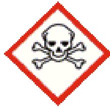
سمیت حاد - استنشاقی - رده ۳