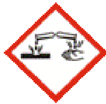
خوردگی / تحریک پوست - رده ۱