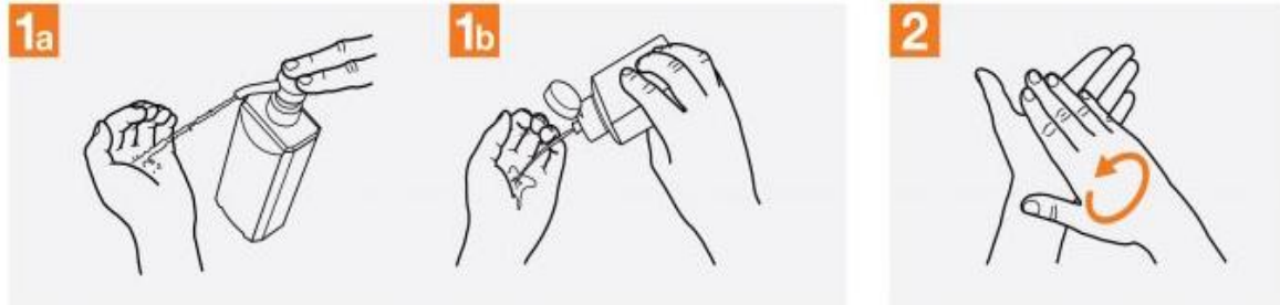
1a کف دست را با مقدار کافی ضد عفونی کننده الکلی پر کنید

تصویر (۲) ضدعفونی دست با محلول های ضدعفونی کننده حاوی الکل