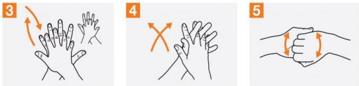
3 کف دست راست را روی پشت دست چپ گذاشته و بین انگشت ها را اسکراب کنید و برعکس