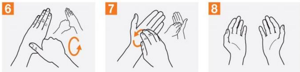
6 انگشت شست دست چپ را با کف دست راست احاطه کرده و به صورت دورانی مالش دهید و برعکس